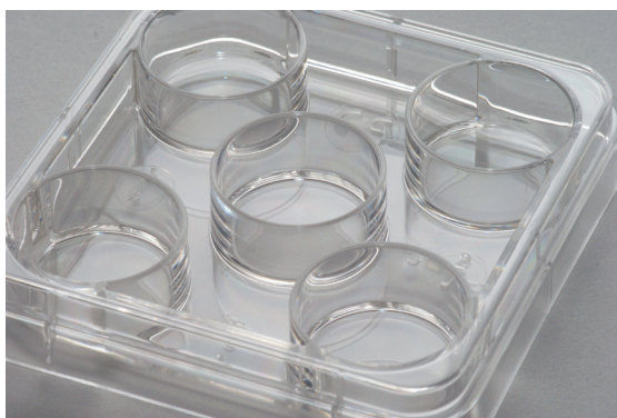
Minitüb 5-well Schale

Die pH-Messung aus dem Medium wurde gestartet, sobald die Schalen in den Inkubator überführt waren und erfolgte in 5 Minuten-Intervallen über einen Zeitraum von bis zu 20 Stunden. Von beiden Schalentypen wurden je drei Schälchen in identischen Durchläufen getestet. Alle pH-Messungen wurden in einem 14 Liter-Inkubator (Galaxy 14 S, Eppendorf, Hamburg / Deutschland) bei 37°C und 5,3 % CO 2 durchgeführt.