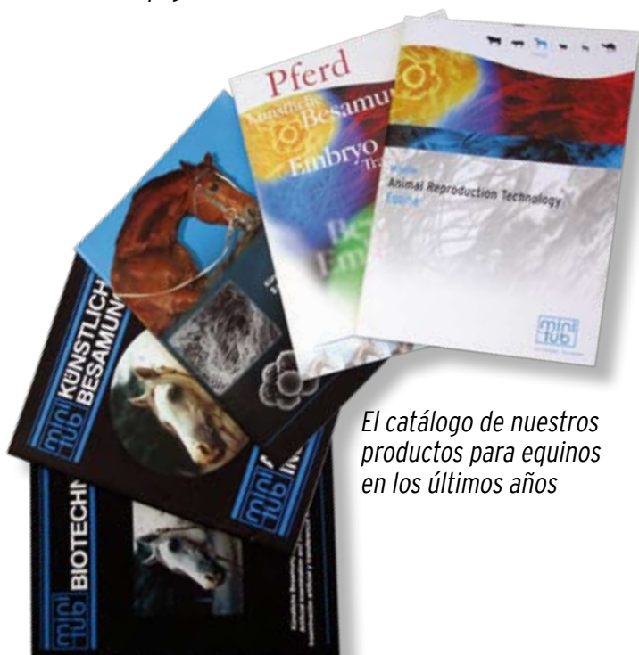
El catálogo de nuestros productos para equinos en los últimos años