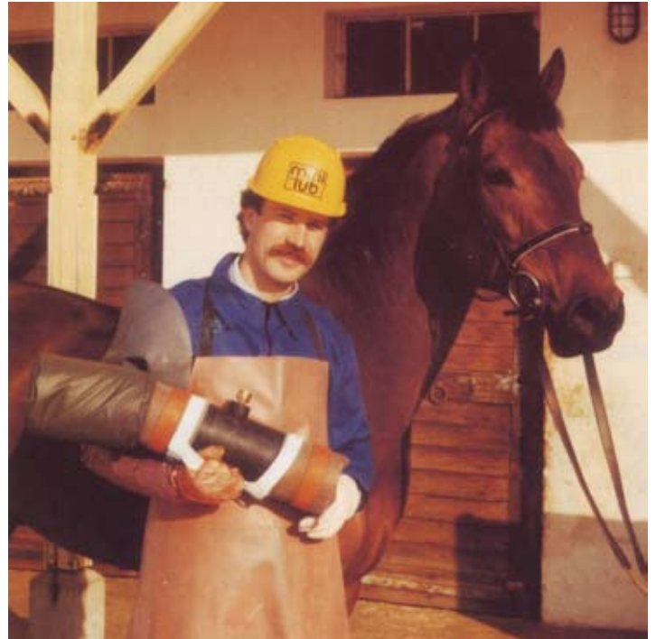
Foto: Dr. Christian Simmet presenta la vagina artificial equina Hannover (Catálogo 1998)

Mediante el progreso y la propia investigación se pudo avanzar decisivamente en el desarrollo de productos para la inseminación artificial y transferencia de embriones en equinos. Ya en 1991 se presentó por primera vez un catálogo completo para criadores de caballos y veterinarios. Junto a muchos otros productos se destacaron a nivel mundial nuestras pipetas universales de inseminación para yeguas, las que son mencionadas en muchos artículos científicos y técnicos, como el "estándar dorado" para la inseminación artificial en yeguas.