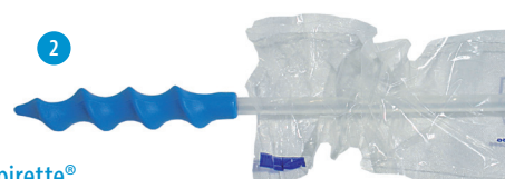
PrimeFit SafeBlue Spirette®