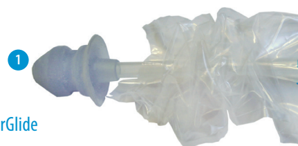
PrimeFit SafeBlue ClearGlide