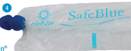
ProFit SafeBlue Foamtip®