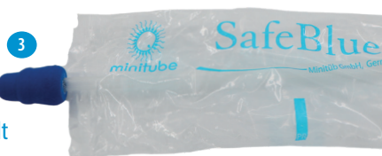
ProFit SafeBlue SoftGilt