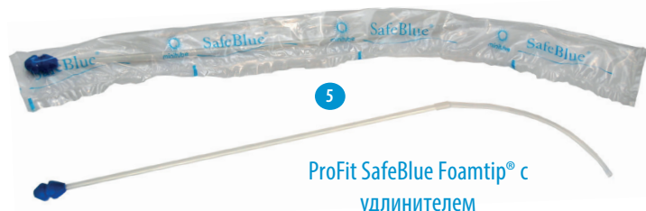
ProFit SafeBlue Foamtip® с удлинителем